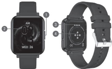
DIAGRAMA DE PRODUCTO