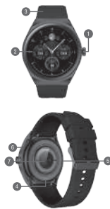
DIAGRAMA DE PRODUCTO