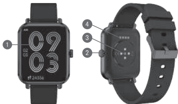
DIAGRAMA DE PRODUCTO