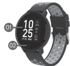
DIAGRAMA DE PRODUCTO